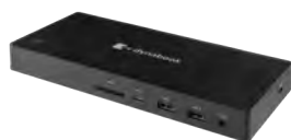
dynabook USB-C-Dock (PA5356E-1PRP)