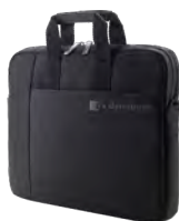
dynabook Notebooktasche B116 (PX1880E-2NCA)