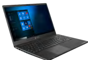
Sichtschutzfilter, (beidseitig,selbsthaftend) (PX1905E-2NAC)