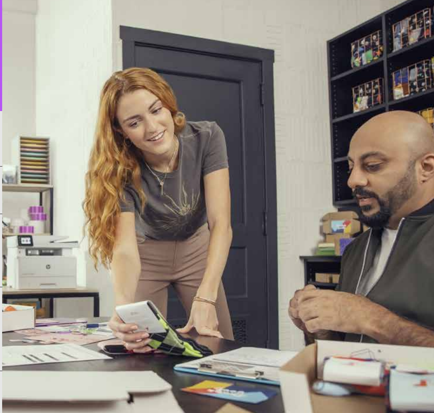
Tonertarife für Schwarzweiß-Laserdrucker

Schicken Sie Ihre leeren Original HP Tonerkartuschen mit den vorbereiteten Versandetiketten kostenfrei an uns zurück. Wir übernehmen das Recycling für Sie.